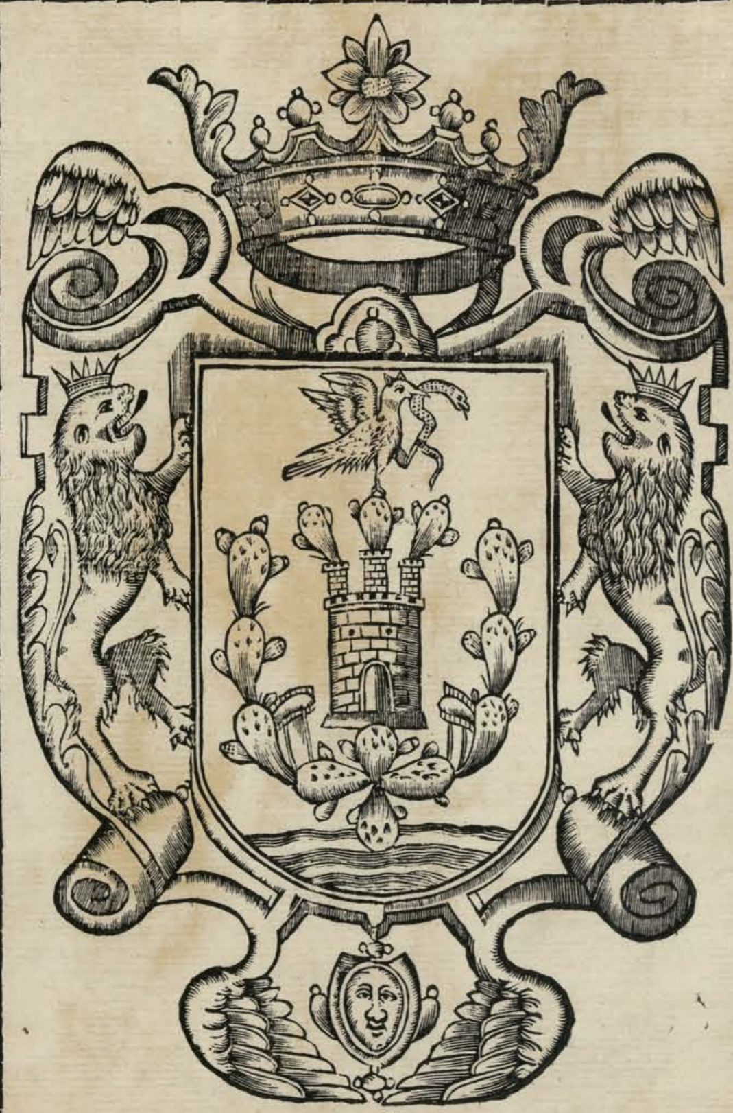
Armas de que vsa la muy noble, Insigne, y muy Leal Ciudad de Mexico, Cabeça, y Corte de toda la Nueva-España: compuestas de las que tenia en tiempo de su Gentilidad: y de las que le dió la Magestad del señor Emperador, por prouision del año de 1523.

Districto de la Audiencia, y Chancillería de la Real Pretorial, que reside en la Insigne, y muy leal Ciudad de Mexico, Cabeça, y Corte de toda la Nueva España con lo eclesiástico y secular que hay en ella