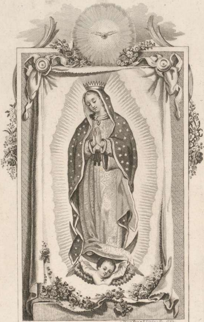
M. MA S. S. DE GUADALUPE DE MEXICO.