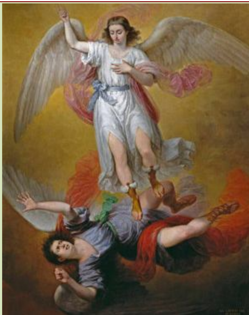
La caída de Luzbel, de Esquivel

José María Pemán y Pemartín Director de la Real Academia de la Lengua