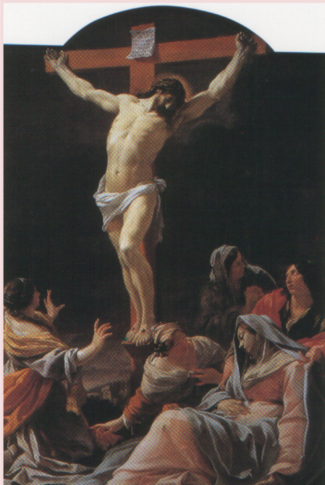
CRISTO EN LA CRUZ , de Simon Vouet Pintura sobre tela, Musée des Beaux-Arts, Lyon

Polígrafo, filólogo, historiador, filósofo, poeta, crítico literario y erudito español