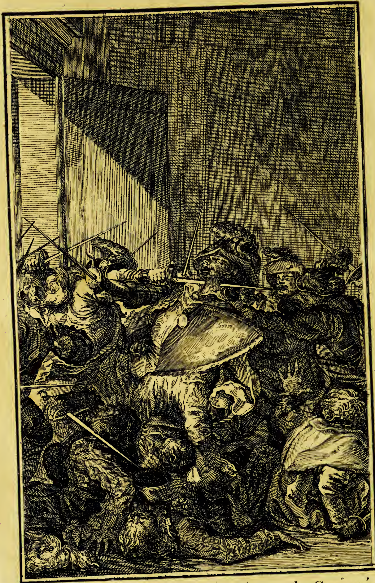
François Pizarre assassiné par une troupe de Conjurés