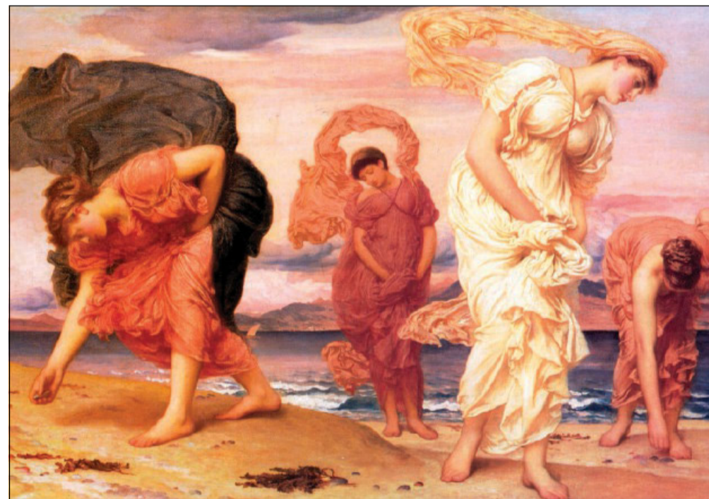
Frederic Leighton, «Ragazze greche che raccolgono ciottoli in riva al mare» (1871)

Eppure, quella sorta di simbiosi trans-temporale, fonte per Beck di «tormentose esaltazioni», se da un lato gli ha propiziato «una non superficiale» conoscenza dell'umanità di Orazio, dall'altro non gli ha permesso di acquisire un'autentica familiarità, se non per squarci e frammenti, con il suo vissuto. «Nello spazio di ogni capolavoro letterario – osserva Beck – si distende una linea di confine oltre la quale l'autore non ci concede di avventurarci. Divieto di accesso. Al di