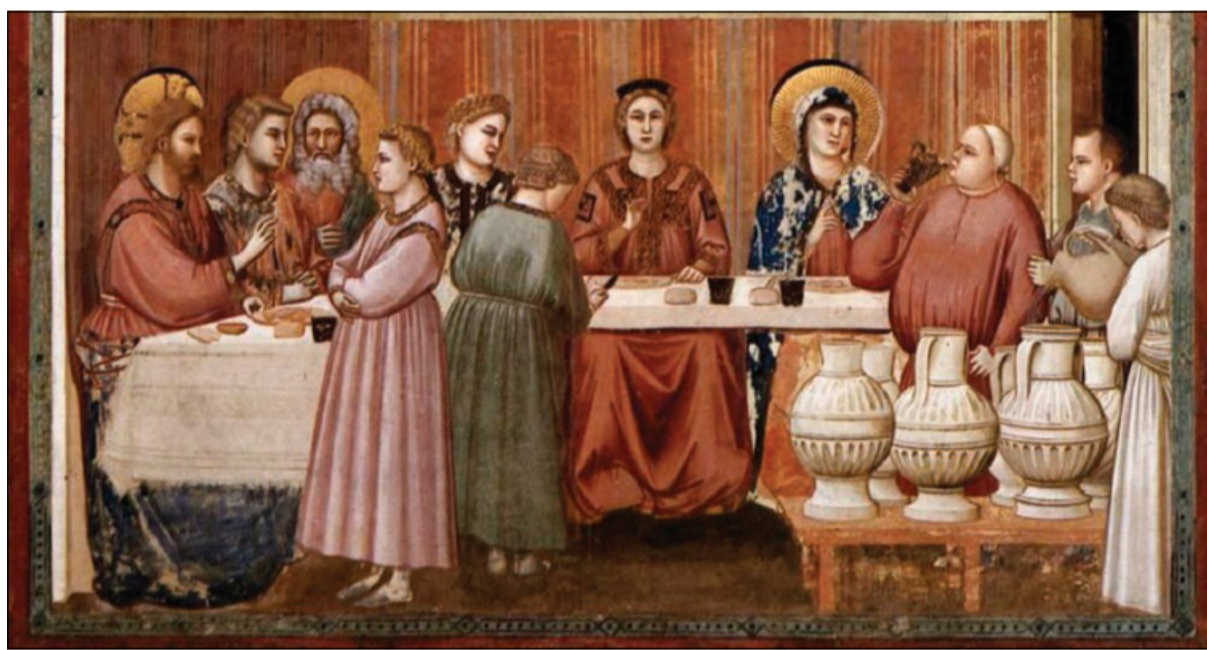
«Le nozze di Cana» (Giotto, Cappella degli Scrovegni a Padova, 1303-1305, particolare)

le annodato in vita, le dita sottilissime, le unghie intrise di farina. Erano mani che sapevano tirare la sfoglia con il mattarello fino a farne un velo grande come il tavolo. Nelle feste grandi era mio nonno a essere arruolato già dalla sera prima: a lui toccava impastare. Lei arrivava dopo, prendeva il ferro dei passatelli e, con due o tre spinte decise, li faceva cadere uno dopo l'altro, come se fosse la cosa più naturale del mondo. Oggi quasi nessuno sa più farlo. Era quello, in Romagna, a dire se una donna era davvero una rezdora : non le parole, le mani. Forse è proprio così che il cuore impara.