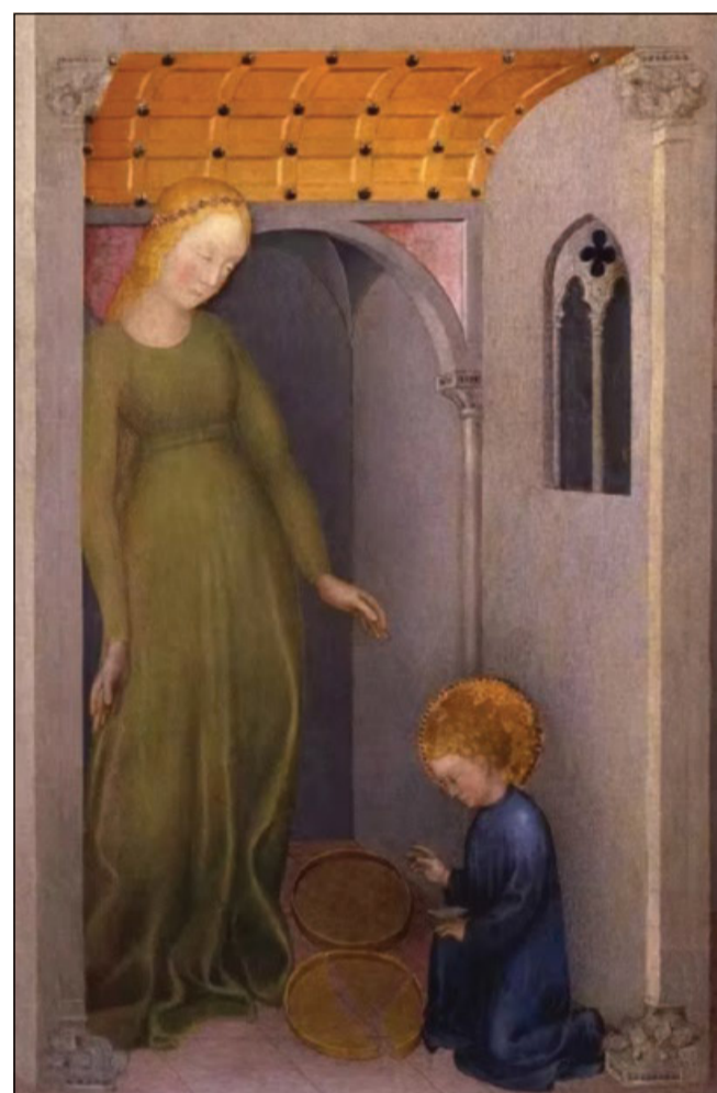
La tempera su tavola (1415-1420) di Niccolò di Pietro

Il piccolo Benedetto si fa così compimento visivo della promessa profeti-