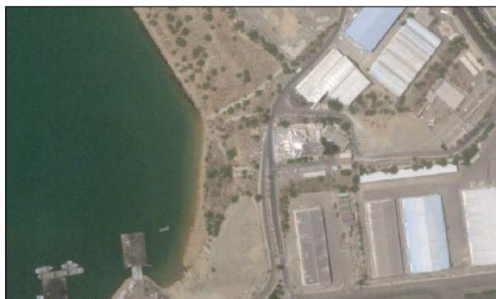
Un'immagine satellitare del porto iraniano di Chabahar

Sul fronte Hormuz, nelle ultime ore, secondo i dati di tracciamento navale, un numero maggiore di