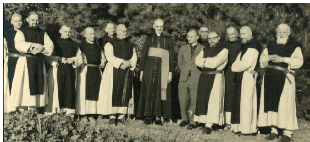
Il cardinale Duval in visita al monastero di Tibhirine (1966, ©Association des Ecrits des 7 de l'Atlas)

Léon-Etienne Duval, di origine savoiarda, arrivò in Algeria nel 1947, per insediarsi nella sede vescovile di Costantina-Ippona. Fu in seguito nominato arcivescovo di Algeri nel 1954, carica che conservò fino al 1988. Durante la guerra d'indipendenza algerina (1954-1962) mantenne una posizione coerente con gli insegnamenti della Chiesa, e in particolare di Pio XI e Pio XII. È sempre rimasto inamovibile sulla necessità di rispettare la dignità fondamentale di ogni persona, al di