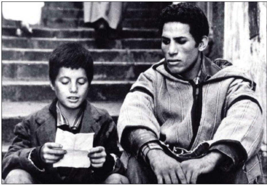
Una scena del film

A sessant'anni da «La battaglia di Algeri» di Gillo Pontecorvo