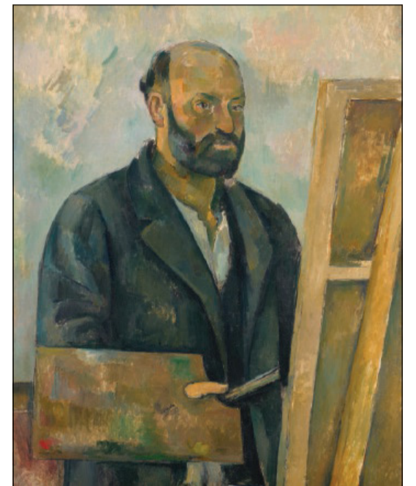
Paul Cézanne, «Portrait of l'artiste à la palette» (1890)

Se si passa nella grande sala dove sono radunate le vedute della montagna-culto di Cézanne