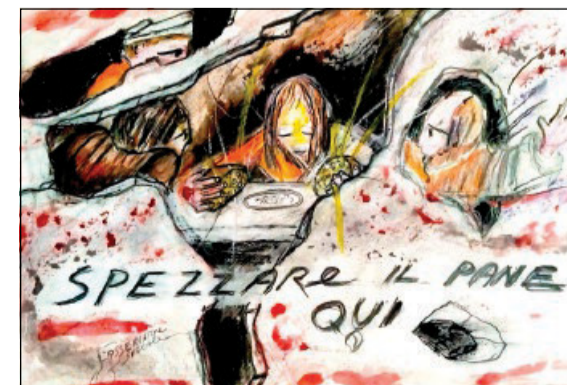
Illustrazione di José Corvaglia