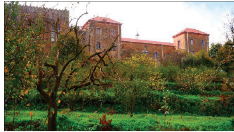
Il monastero di Notre Dame de l'Atlas

Del loro rapimento e del loro assassinio nella primavera