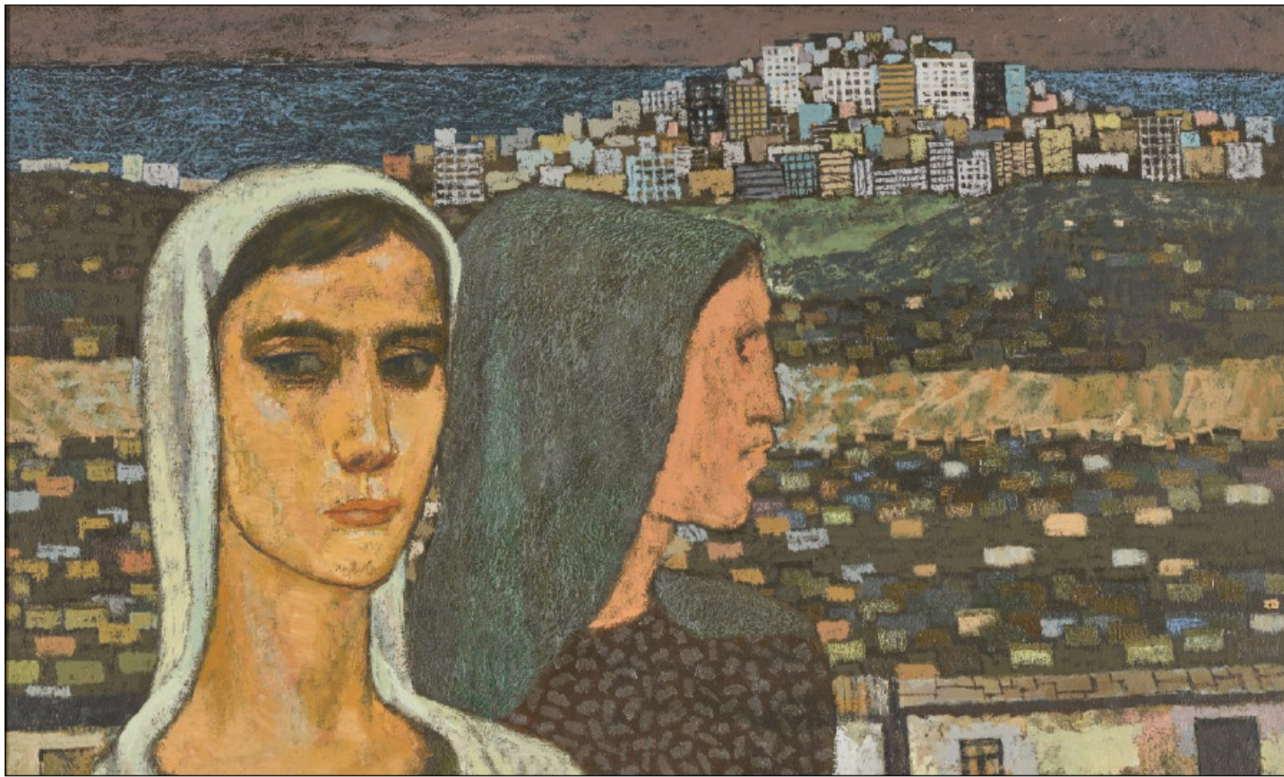
Nuri İyem, «Le donne di Mardin» (1970)

Quando le chiedo come si sia data il permesso di infrangere questa regola del silenzio, Ece risale alle radici: «Forse perché sono cresciuta in una famiglia di sinistra, o perché la mia etica del sé è stata plasmata dal giornalismo, ho sempre pensato che fosse "peccaminoso" mettere me stessa e la mia sofferenza al centro del racconto». Ma poi qualcosa si è rotto. «Quando ho capito che il mondo intero stava vivendo una forma di sradicamento simile alla mia, qualcosa è cambiato. Incontrando rifugiati, esuli, migranti, ho compreso che