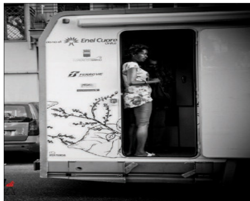
Un'immagine tratta dal sito dei Medici di strada