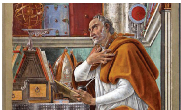
Sandro Botticelli, «Sant'Agostino nello studio» (1480, particolare)

mento di regimi politici, sulle leggi civili. Agostino, partendo da quel fatto non dovuto che è l'avvenimen-