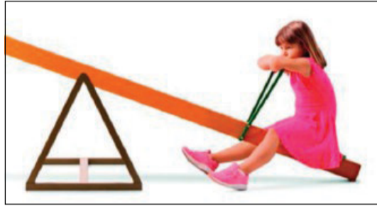
Particolare dalla copertina

una delle regioni a più bassa fecondità del pianeta, minore di altri Paesi con identiche tendenze di sviluppo, anche se la rapidità della nostra crescita economica, assimilabile ad esempio a quella del Giappone e della Corea, sembra essere tra le cause di una parallela discesa nel numero delle nascite, ormai ben al di sotto della soglia minima che garantirebbe il ricambio genera-