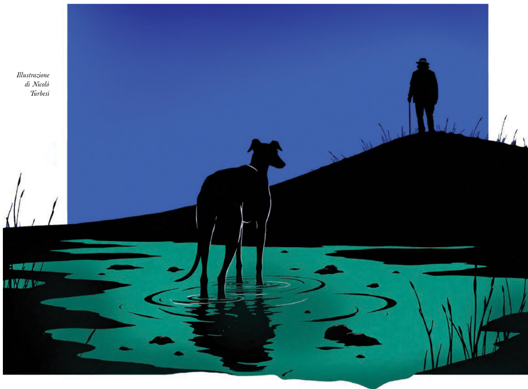
Illustrazione di Nicolò Turbesi

colo e il darsela a gambe di fronte a qualcuno più grosso di te. «Istinto di sopravvivenza», mi dicono che si chiami. E poi il dolore, il capo di ogni sentire. Ho provato dolore, questo è certo. Ogni volta che sono stato in giro, sulle tracce di qualcosa, col compito di uccidere o soltanto di facilitare il compito dell'uccisione ad altri, ho sentito il grande dolore di cui è fatto il mondo. L'ho sentito sulla mia pelle. Graffio di pungitopo, artigliata di biancospino, marchiatura di cardo, morso di serpente, bastonata, calcio nelle costole. Freddo che taglia, caldo che toglie il respiro. Conoscenza del dolore: è ciò che sta sopra ogni altra legge.