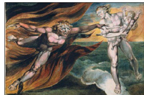
William Blake, «Angeli del Bene e del Male» (1795)

È in questo strazio che si inserisce la logica ferrea dell'Inquisitore. Dal suo scranno, egli promette ordine e pane al prezzo della libertà mentre Cristo tace. E il silenzio del figlio di Dio pesa più di mille parole, perché non offre la sicurezza della ragione, ma la nudità di un gesto. Al termine dell'incontro, infatti, Cristo si avvicina al vecchio Inquisitore e lo bacia. Un bacio che non scioglie il dramma, non elimina il male, non annulla la vertigine, non fornisce alcuna risposta plausibile. Ma è un bacio che apre una dismisura acccecante: la libertà, pur presa nel vortice spaventoso dell'insignificanza, è pur sempre l'unica ferita pulsante, l'unica slabbratura da cui può sgorgare un fiume d'a-