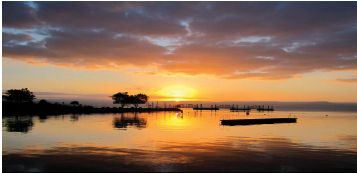
La Giornata europea dei mari

Tuttavia, l'altissimo magistero dei simboli si scontra oggi con la brutalità di una realtà ferita. Quello che La Pira sognava come il Lago di Tiberiade somiglia sempre più, nelle cronache dei nostri giorni, a un tra-