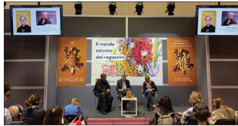
Un momento della presentazione del libro

Cuzzocrea ha sottolineato come oggi la Chiesa non stia ritirata e distante – tentazione che pure esiste – «nella sua virtù» o «in un'idea di superiorità spiri-