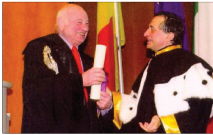
Edgar Morin riceve a Bergamo nel 2002 la laurea Honoris Causa in Scienze dell'educazione

scienza, che le nuove tecnologie rinfocolano; devo resistere alla crudeltà del mondo e alla barbarie e schierarmi con le forze dell'Eros contrastando quelle di Thanatos; posso sperare in ciò che la comunità di destino degli uomini di tutti i continenti, posti di fronte ai pericoli comuni (nucleari, ecologici, economici, geopolitici), fa intravedere: la possibilità di una metamorfosi, non transumanista ma panumanista, nella direzione di una Terra-Patria che inglobi, senza sopprimerle, le patrie nazionali. E più che sulle risposte, Morin ha sempre invitato a riflettere sulla vivezza delle interrogazioni kantiane e al loro riportarci alla necessità continua di conoscere l'umano e la complessità umana. D'altronde, la coscienza della complessità umana conduce alla benevolenza e, come amava ripetere, è un bene essere buoni.