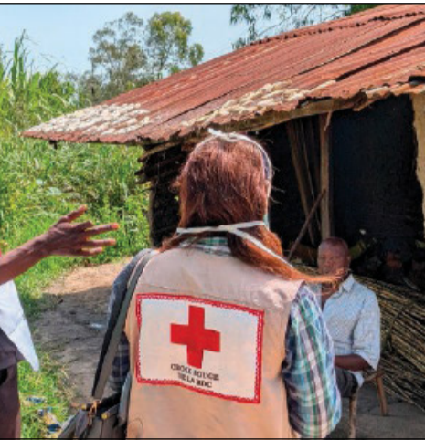
Volontari della Croce Rossa nella provincia dell'Ituri

Una preoccupazione che non riguarda solo il segretario esecutivo di Caritas Congo Absl ma anche l'intera comunità internazionale, come la stessa Catherine Kamatu della Federazione internazionale delle Società della Croce Rossa e delle Mezzaluna Rossa che non esita a lanciare un'ulteriore grido d'allarme: «Le popola-