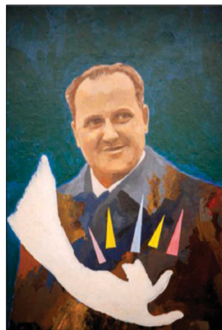
Un particolare della copertina del libro

Lo stesso giorno dell'uccisione di Kennedy, il 22 novembre 1963 a Dallas, Bernabei commentava: «L'orribile morte di Kennedy apre tante incognite nel mondo. Non c'è dubbio che un misterioso disegno della Provvidenza si configura ora, dopo la morte di Papa Giovanni XXIII. Kennedy non voleva la guerra come Giovanni XXIII, e