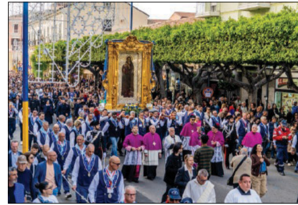
Un momento della processione