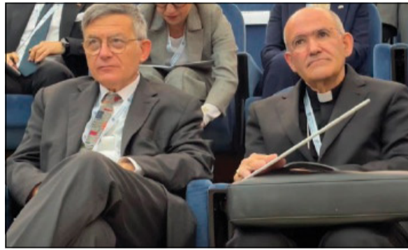
Paolo Ruffini e il cardinale José Tolentino de Mendonça

Per questo dobbiamo custodire volti e voci. Perché in essi c'è non solo un metodo di comunicazione, una scuola di giornalismo, un criterio di formazione, ma la verità di quel che siamo. Che ci chiede di essere liberi.