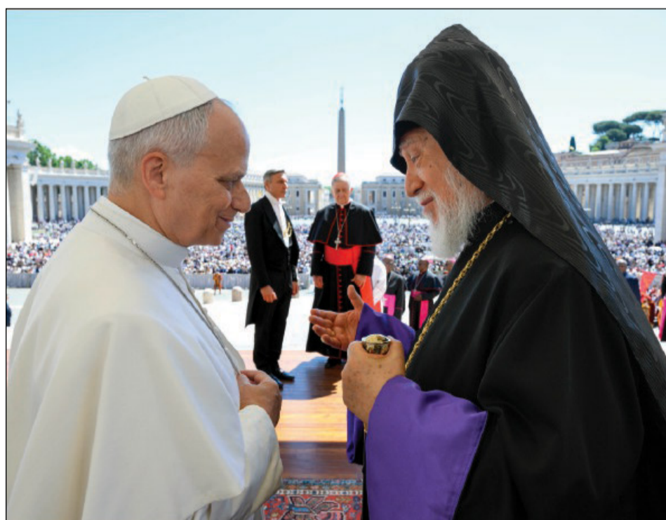
L'INCONTRO CON SUA SANTITÀ ARAM I

In questo quadro d'insieme, la vostra storia testimonia come chi si occupa del mercato finanziario non solo può fare del bene agendo in modo retto, ma anche in-