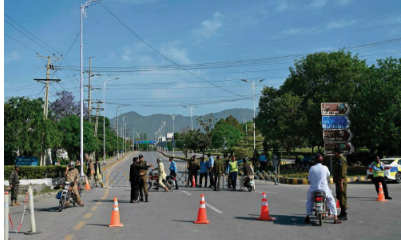
Cordone di sicurezza a Islamabad in vista degli incontri diplomatici

Gli ostacoli più immediati alla via diplomatica appaiono le tensioni sullo Stretto di Hormuz, controllato di fatto dall'Iran, e assieme – avrebbe fatto notare, secondo Reuters, il capo dell'esercito pakistano, Asim Munir, con un ruolo di spicco nelle trattative negoziali – il blocco Usa dei porti iraniani. Tanto più che stamani una petroliera iraniana è passata attraverso lo Stretto, nonostante il blocco imposto da-