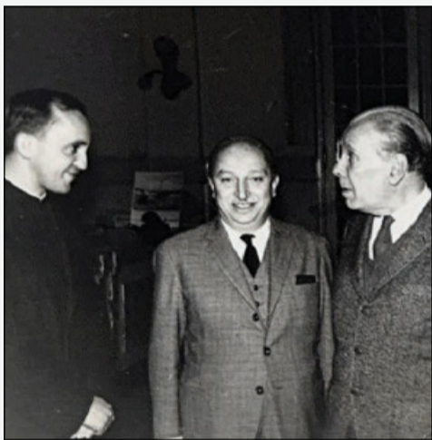
Bergoglio durante un incontro con Borges

P apa Francesco amava la poesia. Spesso ne parlava, pubblicamente nei suoi discorsi, privatamente nelle sue conversazioni. Tra i poeti da lui preferiti c'era senz'altro Virgilio che preferiva a Omero, proprio come il suo connazionale e amico Jorge Luis Borges e ogni vol-