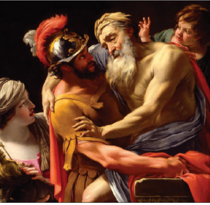
Simon Vouet, «Enea e suo padre in fuga da Troia» (1635, particolare)

nome della patria. Lui farà tutto il possibile per cadere, ma gli sarà negato: «Ceneri d'Ilio e tu ultima fiamma dei miei, / vi chiamo a testimoni: nella vostra caduta non evitai / i dardi né i rischi, e se era destino che cadessi, / l'avrei meritato per mano dei Danai» (Eneide II, 431).