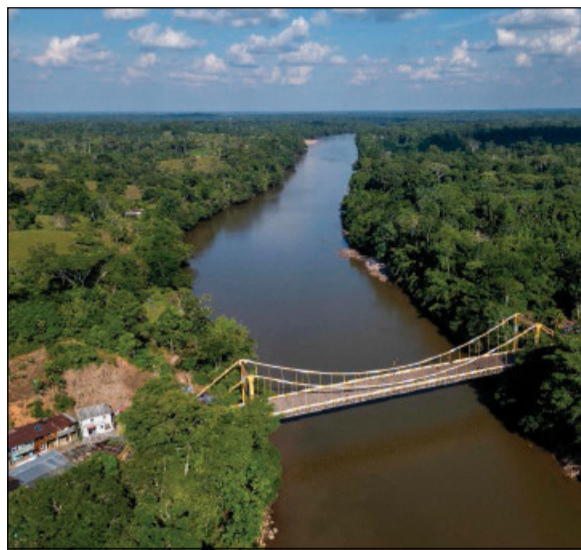
Il ponte San Miguel alla frontiera tra Ecuador e Colombia

D'altra parte, le frontiere in quel quadrante di mondo «sono spesso una zona grigia in cui lo Stato è poco presente e dove proliferano attività illecite»: il riferimento, spiega, è anche alla «triplice frontiera tra Argentina, Brasile e Paraguay, che è un hub molto consistente di traffici illegali». Per quanto riguarda quello tra Ecu-