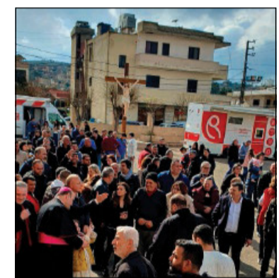
L'accoglienza degli abitanti di Rmeish al nunzio apostolico, l'arcivescovo Borgia, lo scorso 16 marzo

a quando?». Fino a quando dureranno le derrate alimentari di riso e farina che nei tre villaggi ancora garantiscono la