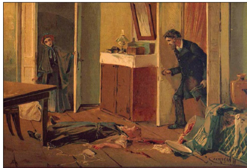
Nikolay Karazin, Illustrazione dalla collezione dedicata a Dostoevskij, (1893)

Il delitto che egli compie – l'assassinio di una vecchia usuraia – nasce proprio come