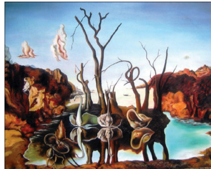
Salvador Dalí, «Cigni che riflettono elefanti» (1937)

Penso che la realtà sia uno dei sogni. Credo che durante il giorno viviamo un sogno collettivo, ma di notte ognuno di noi ha i propri sogni, il proprio mondo rotondo e sferico di immaginazione. I sogni sono