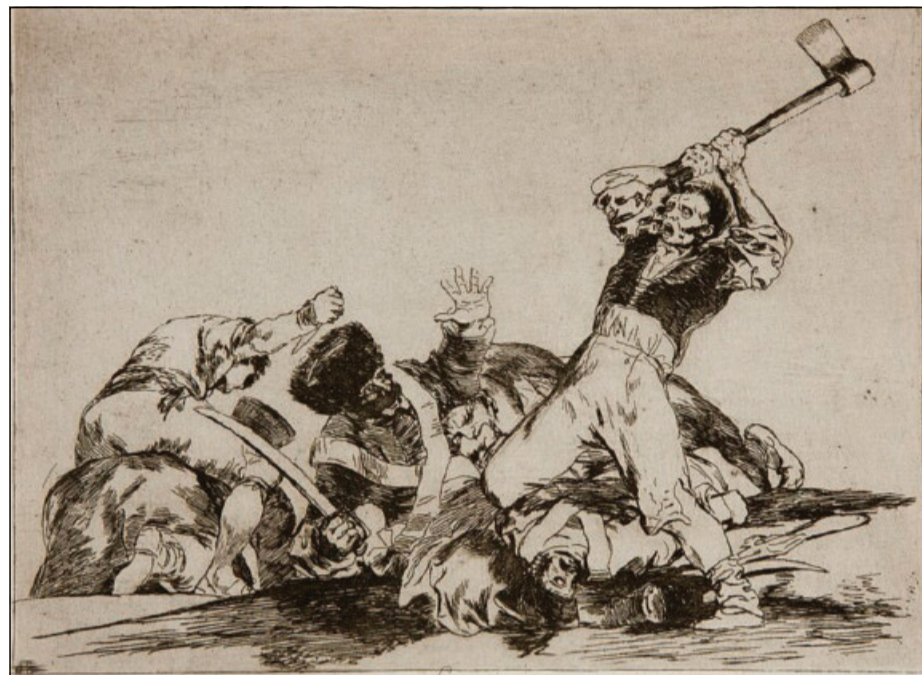
Francisco Goya, «I disastri della guerra» (1820)

ni di pace e l'assenza di conflitti vicini ha alimentato l'illusione che fosse arrivato un tempo nuovo. Abbiamo pensato che la guerra, almeno quella combattuta con le armi, appartenesse ai libri di Storia. Perché è guerra anche la fame, la sete, il freddo, la povertà educativa, le malattie non curate, la solitudine. Così oggi, a quelli consueti dell'indifferenza e dell'assuefazione al male, si aggiunge un rischio in più. È il pericoloso pensiero che la guerra sia qualcosa di inevitabile, che al silenzio delle armi segua sempre il tempo delle ostilità, quasi per un ciclo naturale, come le stagioni che si susseguono le une alle altre. Un pensiero che nasce dalla delusione e che lega passato e presente. Cambiano le armi, non cambia l'animo degli uomini scriveva Lucrezio. Venti secoli dopo la stessa convinzione veniva espressa da Salvatore Quasimodo negli strazianti versi suggeriti dalla tragedia della Seconda guerra mondiale: «Sei ancora quello della pietra e della fionda / uomo del mio tempo». La storia, è vero, non ha cancellato la guerra, ha solo aggiunto mezzi di sterminio sempre più precisi e sofisticati. Dal fatale munus dei greci agli arsenali di oggi stipati fino all'inverosimile di strumenti di osservazione e di ricognizione, di armi convenzionali ad alta tecnologia, di missili che colpiscono a