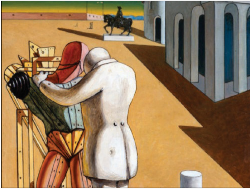
Giorgio de Chirico, «Il figliuol prodigo» (1975)

Pur assumendo spesso i toni di una requisitoria, e potendo a prima vista risultare cupa, l'analisi svolta nella Società tecnologica non è assimilabile a un mero pessimismo. Ellul stesso si definiva un realista: il suo intento era descrivere i meccanismi oggettivi della tecnica, non abbandonarsi a una sterile denuncia. L'opera ha certamente il merito di sottolineare l'ambivalenza dello sviluppo: la tecnica non è né positiva né negativa, bensì una forza autonoma e intrinsecamente contraddittoria, che genera una combinazione inestricabile di avanzamento e distruzione, emancipazione e nuove schiavitù. Anche per questo l'opera di Jacques Ellul resta un monito contro ogni forma di ottimismo acritico nei confronti della tecnologia.