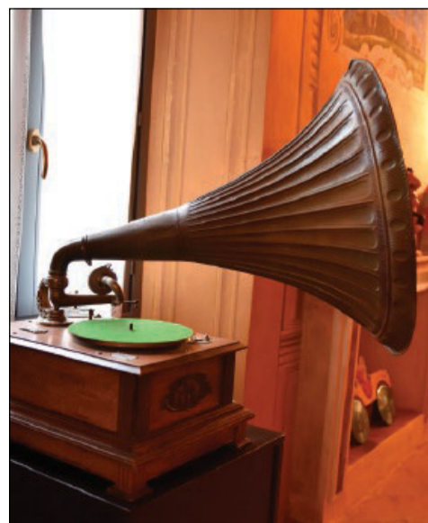
Giradischi esposto al Museo del disco d'epoca a Sogliano al Rubicone

Non è una questione di tecnologia analogica contro digitale, ma di due modalità opposte di relazionarsi con la musica. Da una parte c'è il consumo rapido, frammentato e spesso distratto; dall'altra, un ascolto intenzionale, concentrato, che invita a immergersi nell'album nella sua interezza. Ascoltare un disco significa