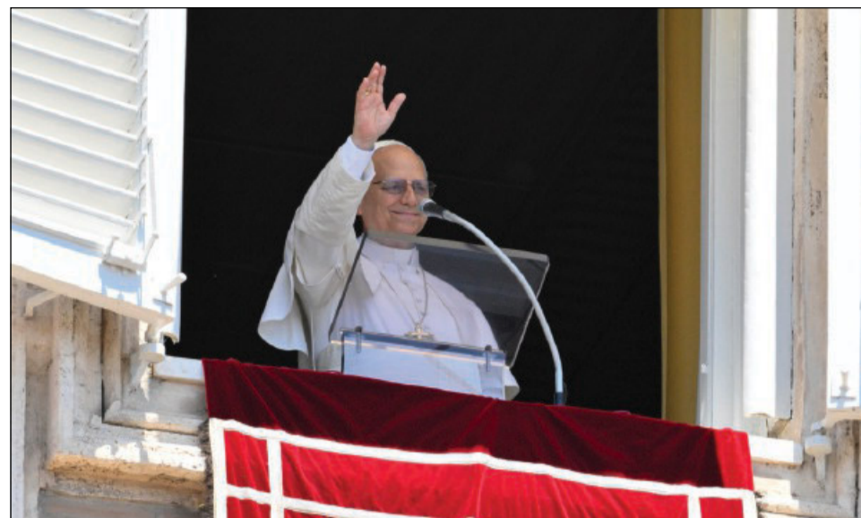
Maria, Dimora dello Spirito Santo e Madre della Chiesa.

Come i primi discepoli, confidiamo nell'intercessione della Vergine