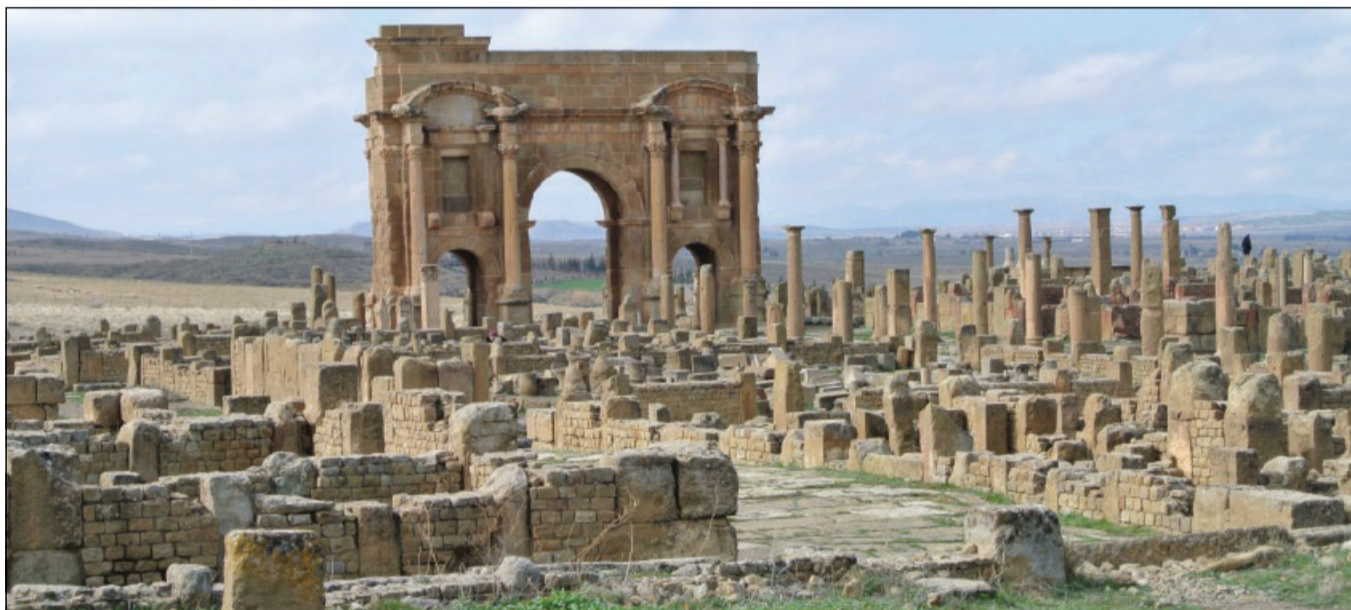
Timgad, in Algeria, conosciuta come la "Pompei africana", fu fondata da Traiano nel 100 d.C.

agricola nelle sue fondamenta, ma urbana nel suo volto pubblico. Roma si vedeva soprattutto nei fori, nelle terme, nelle iscrizioni latine, nelle cariche municipali. Lì le famiglie più importanti cercavano onore e prestigio; lì parlare latino e partecipare alla vita pubblica permetteva alle élite locali di accrescere rango, influenza e autorità.