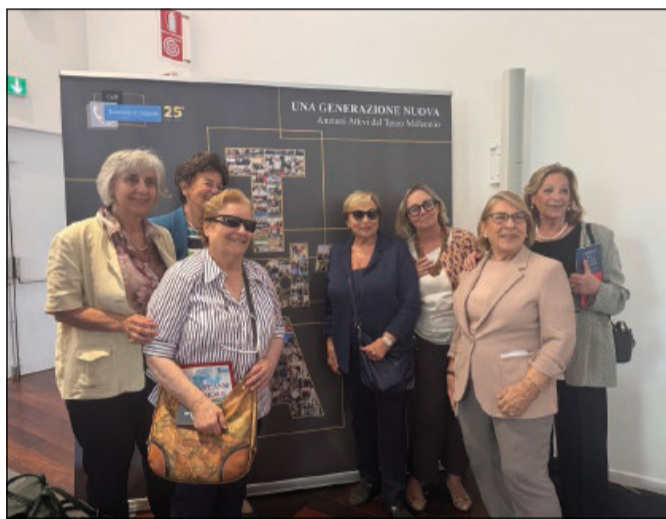
Alcune volontarie del Telefono d'Argento durante l'incontro al museo MAXXI di Roma

Il professore Marco Trabucchi ha richiamato l'attenzione sui caregiver familiari, definiti «curacari», evidenziando il peso umano e psicologico dell'assistenza quotidiana e la necessità di offrire sostegno, informazioni e occasioni di sollievo. In questa prospettiva ha indicato nei «caffè Alzheimer» luoghi preziosi di incontro e condivisione, dove la conoscenza nasce anzitutto dallo scambio di esperienze tra le persone.