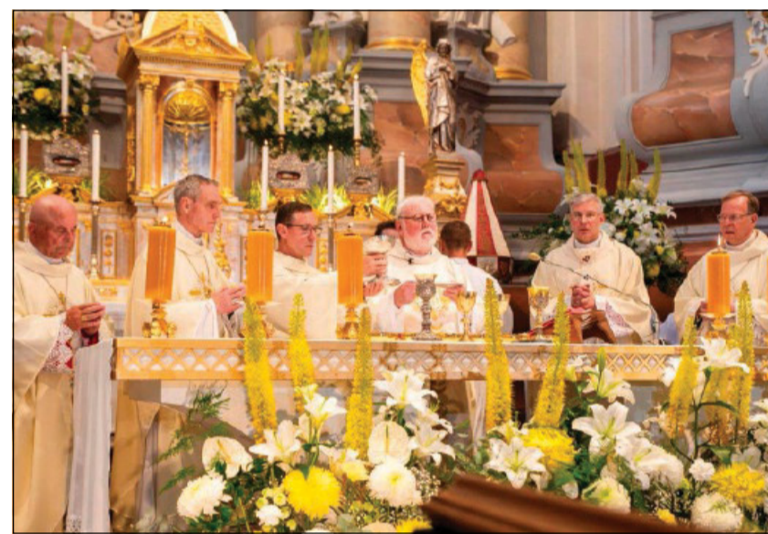
La messa nella cattedrale di Kaunas

«Quanti sacerdoti, religiose e religiosi, insieme a decine di migliaia di fedeli – ha detto il presule – sono stati deportati