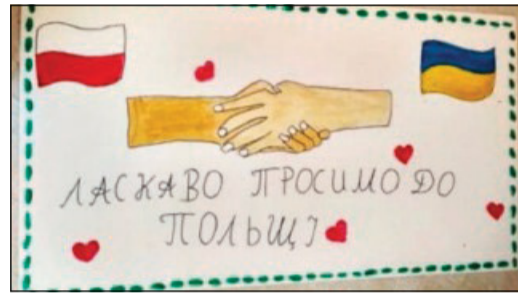
Disegno che invita gli ucraini in Polonia

la capacità di fare il male: «Possono ferire, chiudere la strada all'incontro e generare paura». Leone ha, infatti, ricordato fin dall'inizio del suo pontificato che la pace è «disarmata e disarmata», e «la costruzione del bene comune richiede un linguaggio evangelico: chiaro, ma non umiliante; coraggioso, ma non aggressivo; veritiero, ma tale da non sbarrare la via del perdono».