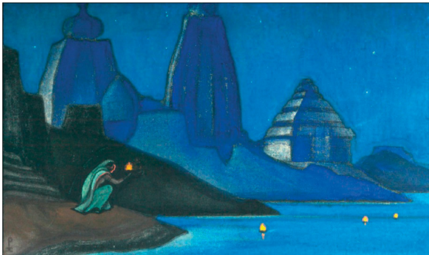
Nikolai Konstantinovič Roerich, «Flame of Happiness Lights on the Ganges» (1947)

Poi, quando venne l'ora, ci collocammo nel cavo della roccia prescelta. Sulla pietra resa stabile con un po' di sabbia deponemmo le tovaglie di lino, il messale e il calice d'argento. Trasportammo in una coppa dell'acqua attinta dove scaturiva il fiume. Per offrire e consacrare, avevamo preso, in-