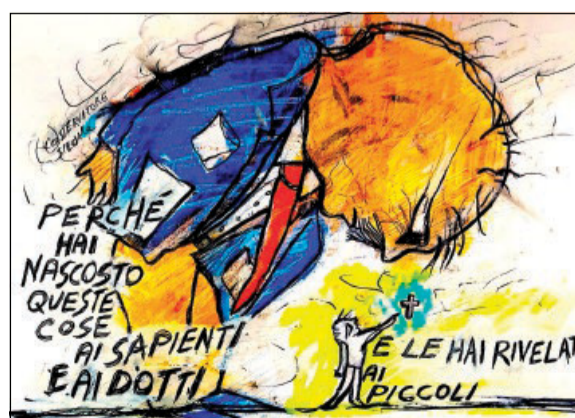
Illustrazione di José Corraçia

Quante volte la sera guardo la televisione e ascolto le parole di esimi professori di filosofia, eccelsi economisti, illustri scrittori, seguo in silenzio le loro frasi taglienti, definitive, indiscutibili. Nessuna affermazione è introdotta da un «mi sembra...», «a volte ho l'impressione che...», «forse potrebbe essere che...». Mai. Sono sempre parole perentorie, che scendono giù di taglio come accette. Loro sono i sapienti,