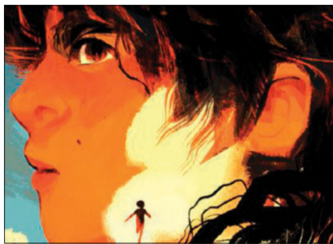
Particolare della copertina

saremmo abbracciati e che le importava così tanto che piangessi che poteva persino piangere con me. E sentii per la prima volta che l'allegria può stare nello stesso posto della tristezza, passare dalla stessa porta, vivere nello stesso cuore».