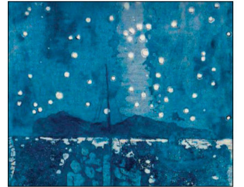
Particolare della copertina

Nella sua prefazione, Parisi individua a ragione una delle caratteristiche principali del libro nella capacità di tenere insieme il rigore dell'analisi e la volontà di rivolgersi a un pubblico ampio, non necessariamente specialista dei temi affrontati. De' Angelis e Piovani