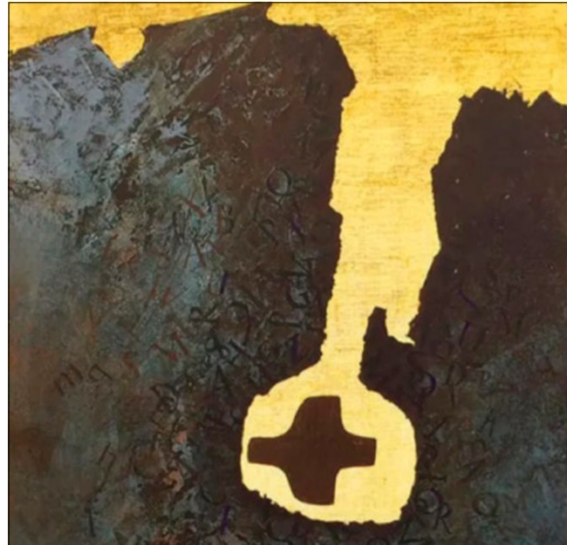
Arcabas, «Apriva loro le scritture» (1994-1995, particolare)

Con Bach il linguaggio cambia di nuovo. Christ lag in Todes Banden BWV 4 è una cantata pasquale in senso pieno: nasce dal corale di Lutero che rielabora la tradizione latina e mette in musica, strofa dopo strofa, il nucleo della fede cri-