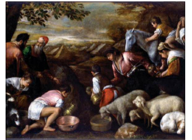
Esodo degli ebrei dall'Egitto Leandro Bassano, Gallerie dell'Accademia di Venezia

Inoltre, nella Mishnah (m. Avot 6, 2) troviamo l'insegnamento del rabbino Yehoshua ben Levi, che mette in relazione la parola herut con la parola dal suono simile harut , o «scolpito». In Esodo , 32, 16 leggiamo: «Le tavole [con i dieci comandamenti] erano opera di Dio, scolpita [ harut ] sulle tavole». Aggiunge che «di fatto nessuna persona è libera eccetto quella che si dedica allo studio della Torah». Pertanto, lo studio della Torah e dei suoi precetti, insieme alla loro osservanza, mira in primo luogo a liberare l'individuo ( Bereshit Rabbah 44, 1; Maimonide, Guida , III, capitolo 26). Essere una persona libera non è solo una questione di circostanza, ma anche il risultato di una crescita spirituale. Il cammino di libertà che Dio ha dato al popolo d'Israele durante la sua liberazione dall'Egitto doveva servire come fondamento della cultura ebraica per tutte le generazioni a venire.