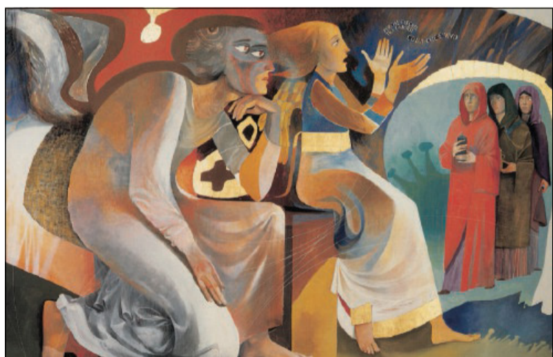
Arcabas, «Resurrezione» (1994-1995, particolare)

La musica scritta per la Pasqua, o nata dalla sua irradiazione, si riconosce proprio in questo tratto comune: non è semplicemente "festosa", e soprattutto sa che la luce pasquale non è decorativa, ma va conquistata. La sequenza medievale la custodisce come certezza raccolta, Palestrina la fa diventare ordine e trasparenza, Bach la costruisce come vittoria, Händel la espande nello spazio del "teatro spirituale", Rimskij-Korsakov la illumina con la tavolozza timbrica del sinfonismo moderno. Tutti mantengono stretto il riferimento alla sconfitta della morte. Forse è proprio questa la ragione per cui la grande musica pasquale continua a parlarci ancora oggi. Non perché dimostri qualcosa, ma perché fa sentire che il tempo, dopo quella soglia, non è più lo stesso.