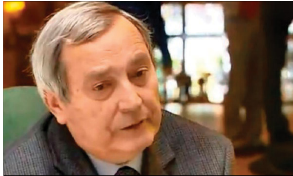
che è risorto (2000), Ipotesi su Maria (2005).

Nel 1976 esce il suo primo e fondamentale saggio, Ipotesi su Gesù , frutto di dodici anni di studio. Un libro che indaga sulla storicità del Nazareno rendendo accessibili a tutti contenuti solitamente confinati nella stretta cerchia degli esperti. È stato, senza volerlo né averlo pianificato, l'iniziatore di una nuova e moderna apologetica, condotta con estremo rigore. Nel 1978 si trasferisce a Milano, per far nascere «Jesus» il nuovo mensile dei Paolini, nella cui redazione lavorerà alcuni anni per poi continuare a collaborare ma da esterno. Nel 1982 pubblica Scommessa sulla morte , denunciando la crisi del marxismo. Ma è la storicità dei Vangeli ad attrarlo particolarmente: a quel primo fondamentale libro dedicato a Gesù ne seguono altri che sistematizzano le ricerche alle quali continuerà a dedicarsi con passione per tutta la vita: Inchiesta sul cristianesimo (1987), un viaggio in dialogo con cristiani, credenti di altre religioni, atei, agnostici; Patì sotto Poncio Pilato (1992), Dicono