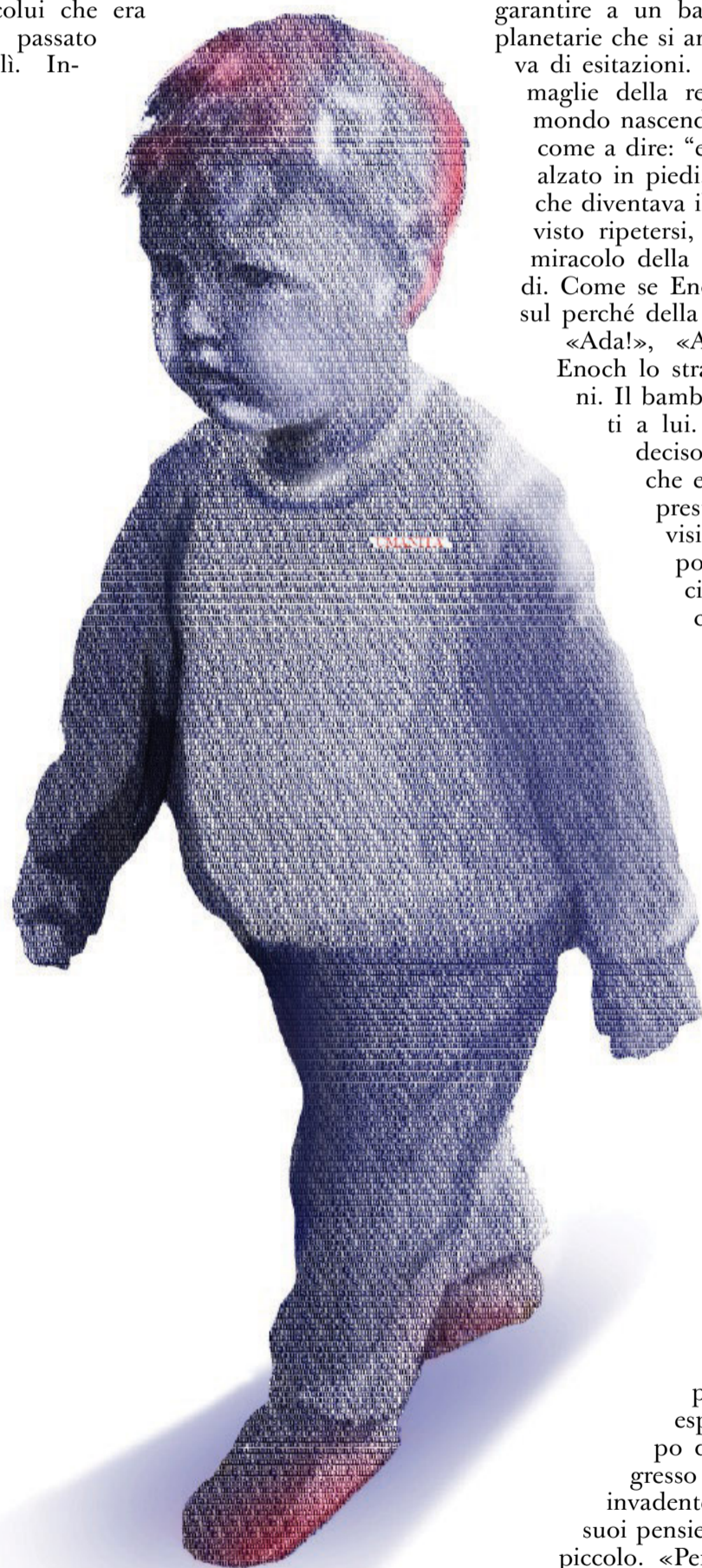
Illustrazione di Giulia Culicchia

zione reciproca delle due sepolture sotto lo stesso tetto, quella di Adamo e quella del nuovo Adamo. La prima era vuota, come erano vuote tante delle tombe visitate e svuotate dai ladri alla ricerca di braccialetti e di collane. L'altra era aperta: era, tutt'al più, il luogo di un passaggio. Di quel passaggio esisteva una traccia, seppure minima? Nash, l'antropologo, sognava di raccogliere sotto il rivestimento di marmo, direttamente sul calcare, l'impronta genetica di colui che era solo passato di lì. In-