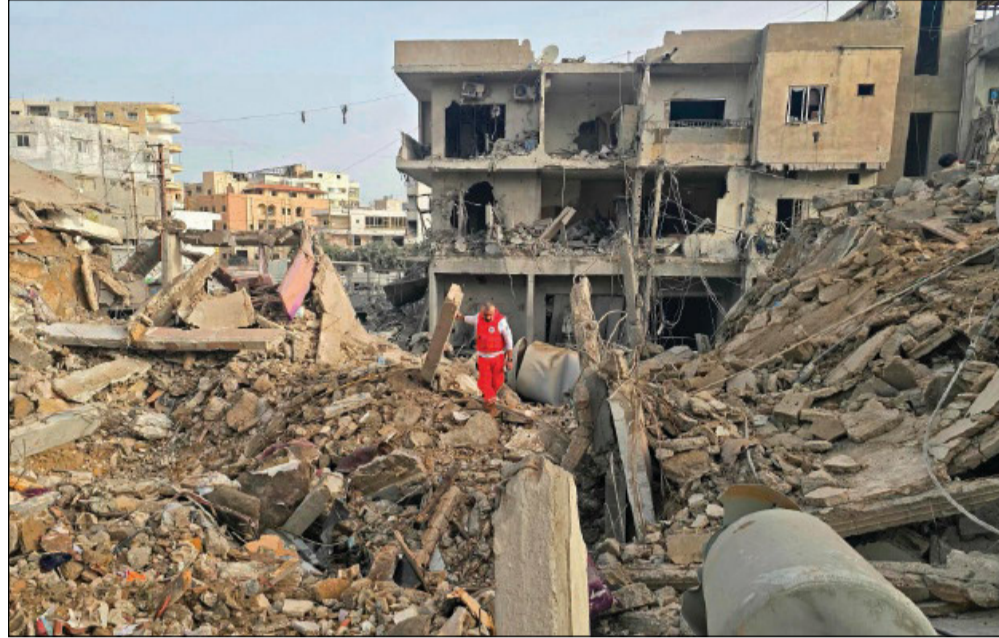
Edifici distrutti dopo un attacco israeliano nella zona di Tiro

Le tensioni a livello diplomatico rispecchiano di fatto il corso delle operazioni belliche. Due caccia americani in volo nei cieli tra il Golfo e l'Iran sono stati abbattuti. Si cerca uno dei piloti, mentre altri due sono stati tratti in salvo. La tv di Stato iraniana ha annunciato una taglia disposta dalla polizia, che avrebbe chiesto ai cittadini di dare la caccia al militare statunitense