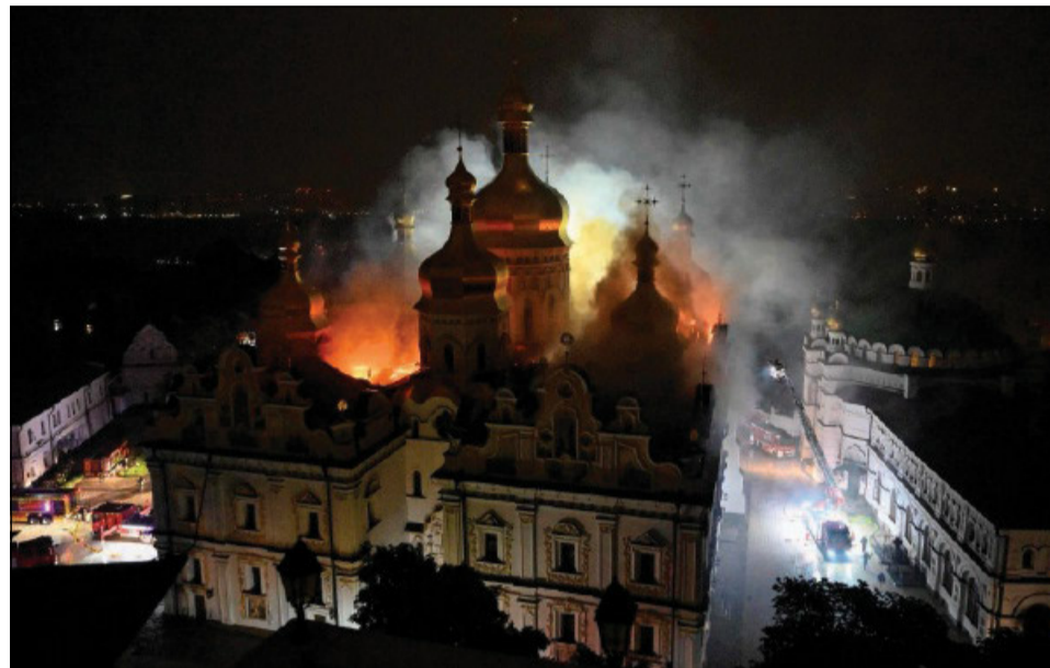
L'attacco russo avvenuto nella notte tra il 14 e il 15 giugno

Oltre a essere un centro di vita monastica, la Kyievo-Pecherska Lavra fu una delle principali culle della cultura cristiana della Rus' di Kyiv. «Tra gli autori medievali della Lavra il nome più importante è quello di Nestore, tradizionalmente ricordato come il Cronista», osserva Dmytro Hordienko. «Ritengo però che non sia stato lui a scrivere la celebre Cronaca degli anni passati e che l'opera non sia stata redatta nel monastero, anche se il suo autore utilizzò probabilmente testi e documenti provenienti dalla comunità monastica». È invece certo che Nestore sia l'autore della Vita di san Teodosio e della Vita dei santi Borys e