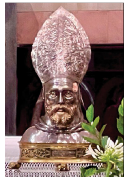
Il reliquiario di san Colombano

Il Sommo Pontefice apprezza in particolare il fatto che, nel nome di San Colombano e quasi imparando da lui a non tenere per sé i doni di Dio ma a dividerli con tutti, le Giornate Colombane abbiano