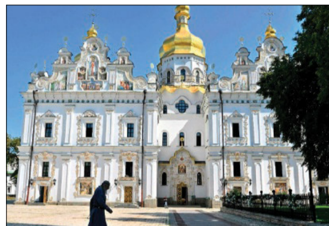
La Kyievo-Pecherska Lavra

Per contro, droni ucraini a lungo raggio hanno colpito obiettivi nella Crimea, provocando interruzioni dell'energia elettrica a Sebastopoli, sede della Flotta russa del Mar Nero. Altri attacchi hanno interessato infrastrutture energetiche e logistiche considerate strategiche per il rifornimento delle linee sul fronte meridionale.