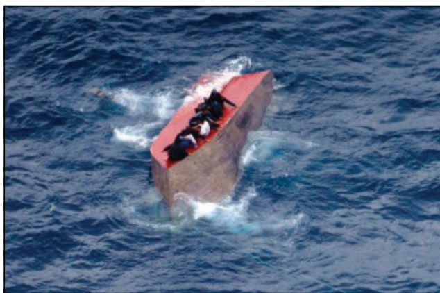
Il naufragio di Pasqua, con oltre 80 migranti dispersi in mare, uno degli ultimi drammi avvenuti nel Mediterraneo