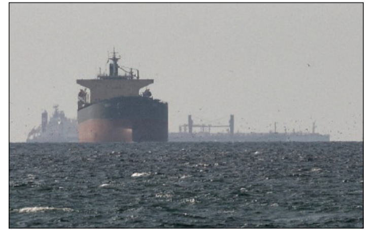
Navi da carico nel Golfo, nei pressi dello Stretto di Hormuz

Era stato il primo ministro del Pakistan, Shehbaz Sharif, a dare conto dell'intesa per una tregua, valida «ovunque, inclusi il Libano e altrove», aveva precisato. Discordanti, però, su quest'ultimo punto le dichiarazioni dell'ufficio del primo ministro israeliano, Benjamin Netanyahu. «Israele sostiene la decisione