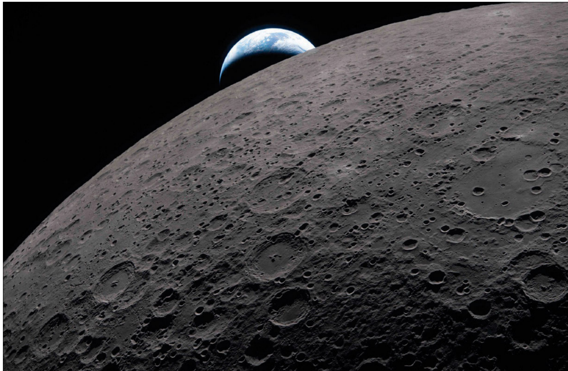
La superficie lunare in primo piano mentre la Terra tramonta sullo sfondo

A bordo della capsula Orion, sostenuta anche dal contributo europeo attraverso il modulo di servizio realizzato dall'Agenzia Spaziale Europea, viaggiano quattro astronauti: Reid Wiseman, comandante della missione, Victor Glover, primo afroamericano destinato a spingersi oltre