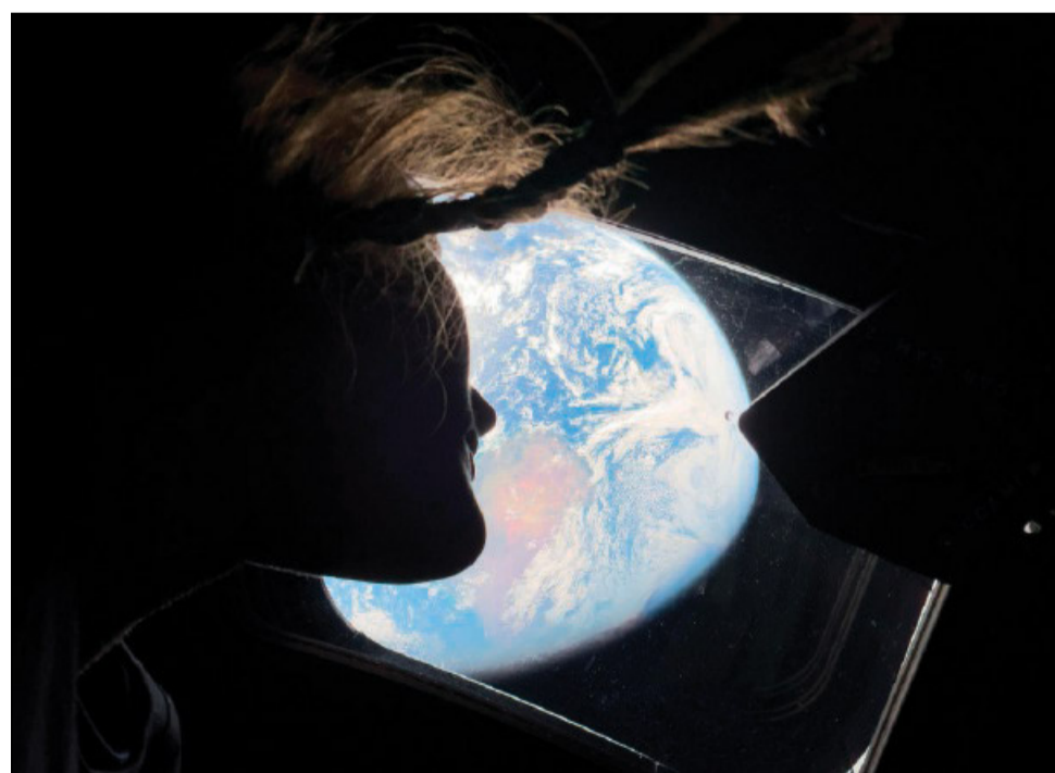
L'astronauta Christina Koch, guarda la Terra dal finestrino della navicella Orion

Una domanda che richiede audacia, ma la cui alternativa è il mondo lacerato da violenze cui pericolosamente rischiamo di abituarci. ( elia carrai )