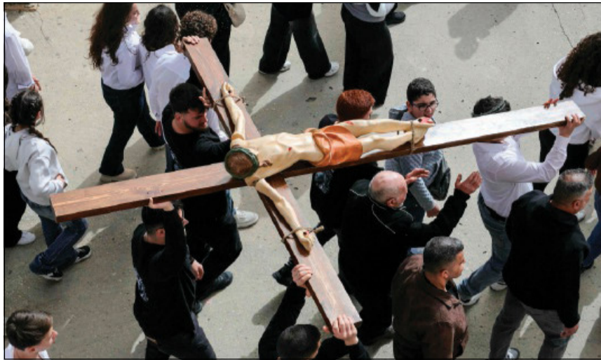
Celebrazione della Via Crucis in un villaggio libanese al confine meridionale di Qlayaa

L'arcivescovo Borgia si è dovuto fermare quindi alla base Unifil di Deir Kifa. Da lì, attraverso i media libanesi che seguivano i tir, ha letto in tv le parole indirizzate da Leone XIV ai cristiani di Debel. Nel messaggio, a firma del cardinale segretario di Stato, Pietro Parolin, il Papa — che ha visitato il Libano nel dicembre 2025 — ha espresso «vicinanza» e «affetto paterno» a tutti i cristiani che hanno celebrato la Pasqua in «circostanze drammatiche». Un messaggio «di consolazione e di compassione» quello che Leone XIV ha voluto far giungere a questa popolazione come pure «a tutti i cristiani del Libano meridionale e a tutte le persone che soffrono le conseguenze della guerra».