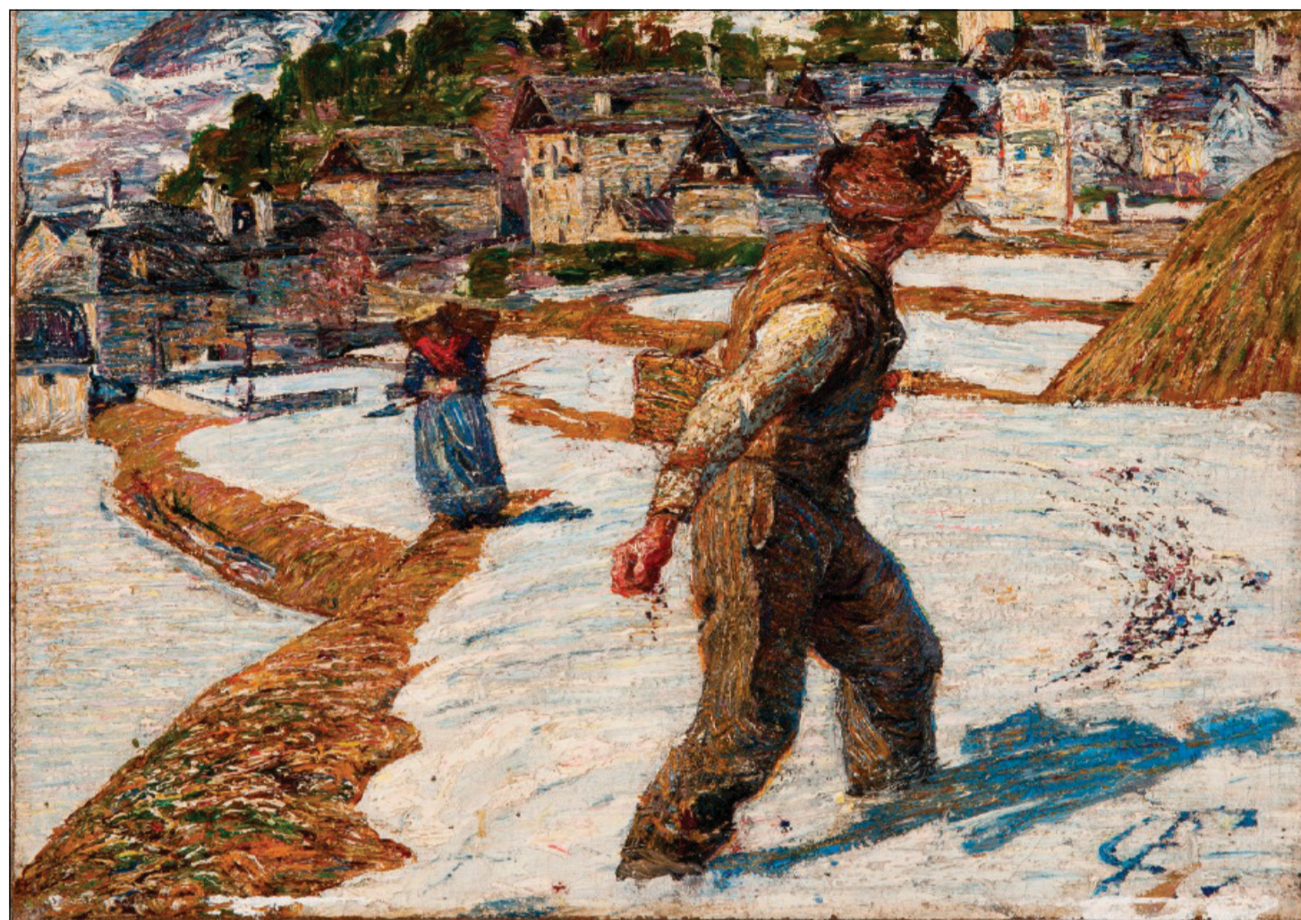
Carlo Fornara, «Il seminatore» (1896-1897)

Ciò appare tanto più necessario quanto più la nostra società appare incamminata sulla strada di dare ai suoi problemi risposta di morte anziché di vita. La guerra, è vero, è stata sospesa nel Vietnam, ma è continuata nei Paesi limitrofi. La violenza e la morte sono la regola di convivenza di popolazioni colonialmente o politicamente dipendenti e dei molti Paesi in cui manca un regime di libertà; e drammaticamente scoppiano anche in Paesi di antica civile tradizione come proprio in questi giorni ci ammonisce la tragedia del Cile. Ma soluzioni di morte sono perfino teoricamente giustificate (...). L'amore alla vita, la difesa del diritto alla vita, l'accoglienza della vita debbono ispirare la