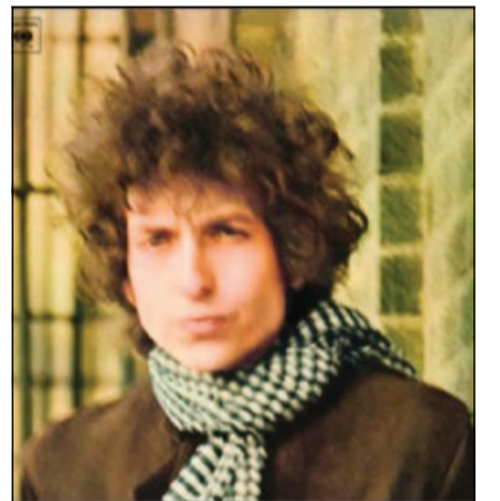
La copertina di «Blonde on Blonde»

È proprio un atto di rivendicazione della propria libertà intellettuale che apre Blonde on Blonde , che si scandisce al ritmo della marcia di Rainy day women #12 & 35 , nella quale vengono schivate tutte quelle pietre che i «moralizzatori del buon gusto» si sentono in dovere di lanciare, pretendendo che l'artista debba unicamente corrispondere al