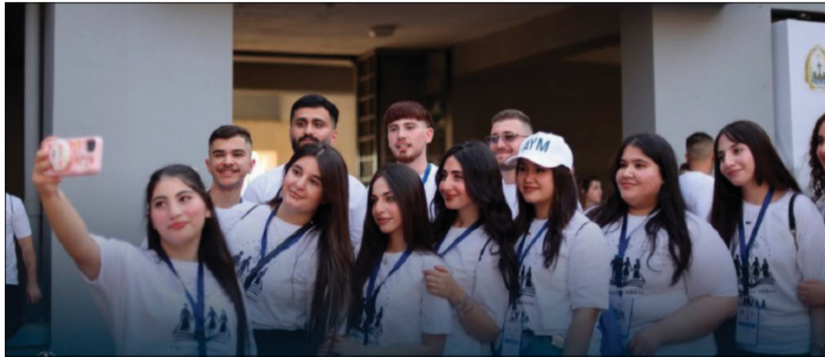
Alcuni partecipanti all'Ankawa Youth Meeting 2026 in corso ad Erbil, in Iraq

I giovani sono chiamati a irradiare la luce di Cristo in un mondo segnato da guerra e instabilità e in «un'oscurità che, talvolta, può apparire sovrachianta». È l'incoraggiamento di Leone XIV ai partecipanti all'Ankawa Youth Meeting (AYM), in corso fino a sabato 11 luglio nell'arcieparchia di Erbil, in Iraq. Lo ha rivolto attraverso un videomessaggio in lingua inglese trasmesso nel tardo pomeriggio di ieri, 8 luglio, in apertura dell'incontro. Di seguito, in una nostra traduzione, le parole del Pontefice.