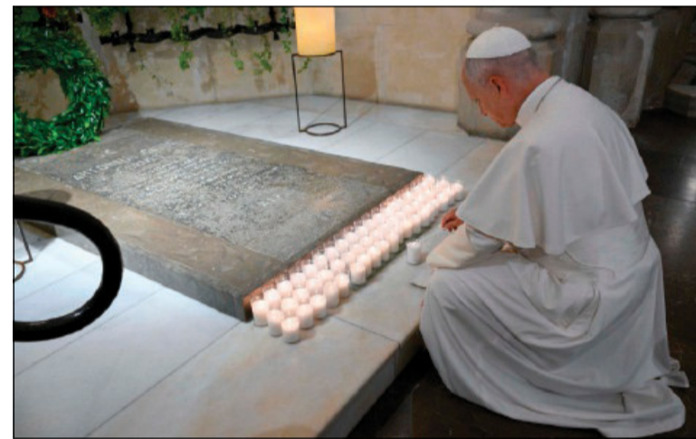
Il Papa in preghiera sulla tomba del venerabile Antoni Gaudí (Barcellona, basilica della Sagrada Família, 10 giugno 2026)

L'Ufficio per le Cause dei santi della Conferenza episcopale spagnola promuove una "pastorale della santità", trasversale a tutte le realtà pastorali, affinché la chiamata universale alla santità del Concilio Vaticano II risuoni