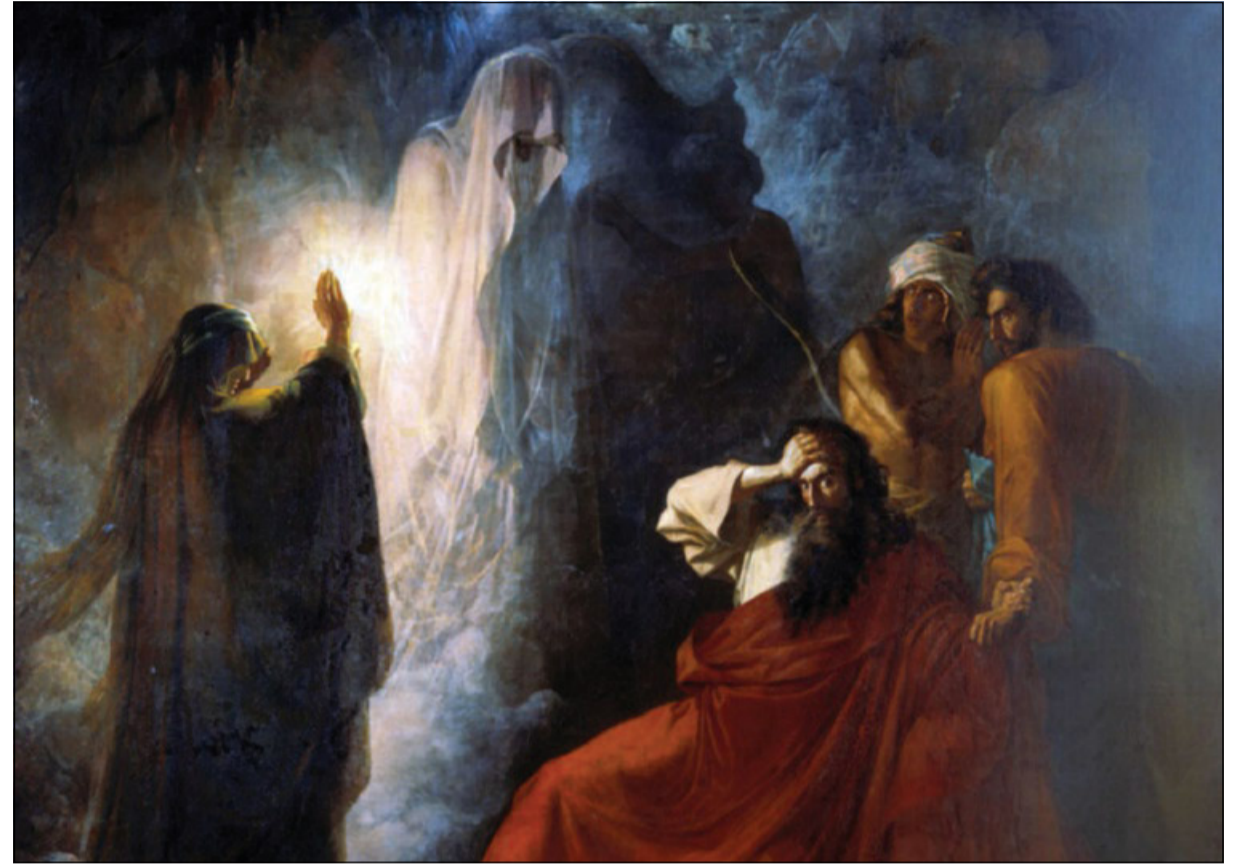
Nikiforovich Dmitry Martynov, «Il fantasma di Samuele invocato da Saul e la strega di Endor» (1857, particolare)

osciuti. La presenza accanto a testi sicuramente agostiniani è un indizio, ma certo non una prova, di autenticità; questa è sopraggiunta attraverso l'analisi del testo che ha rivelato, così ho letto, un usus scribendi del tutto conforme a quello di Agostino. Ci si potrebbe chiedere come mai questi due discorsi dell'Ipponense non sono stati diffusi come molti altri; posso azzardare, ma è solo un'ipotesi, che il loro argomento ha remato contro di loro. Agostino, infatti, tratta dell'episodio della negromante di Endor, alla quale Saul chiede di evocare l'anima di Samuele (1 Samuele 28). Si tratta di un brano problematico, perché sembra affermare che l'evocazione dei trapassati, ancorché vietata, sia possibile, e se ne sono occupati grandi esegeti dell'antichità, quali Origene, Eustazio di Antiochia e Gregorio di Nissa. Forse ad alcuni copisti medievali sembrò poco interessante una trattazione omiletica di questo tema (che, per altro, Agostino affronta nel De diversis quaestionibus ad Simplicianum e nel De octo Dulcitii quaestionibus ); ma sarà necessario