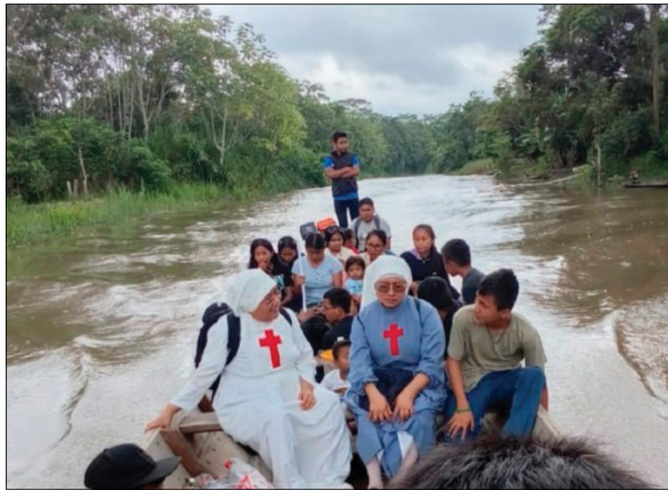
Due suore camilliane su un'imbarcazione lungo il fiume Napo