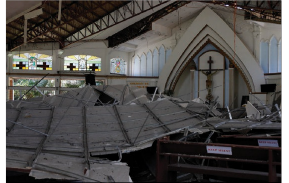
Una chiesa della diocesi di Marbel colpita dal terremoto

registrate oltre mille scosse di assestamento. «Ieri – ricorda Rances – in alcune località sono state osservate piccole onde di tsunami di circa 1 metro ma, alla fine, l'allerta è stata revocata. Sebbene al momento non vi siano nuovi allarmi tsunami in corso, le autorità continuano a raccomandare la massima vigilanza, soprattutto in considerazione del rischio di nuove ondate si-