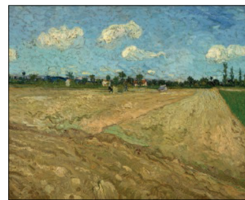
Vincent Van Gogh, «Campi arati» (1888)

La coltivazione, dunque, senza proclami, suggerisce una pedagogia