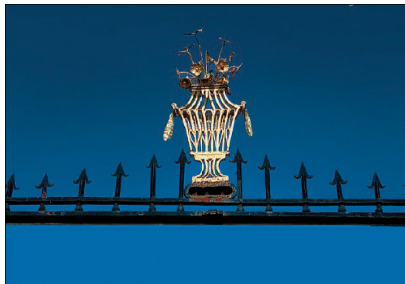
Particolare della copertina

Bizzarro questo somigliarsi e odiarsi: conoscere alla perfezione i propri vizi e difetti ma, riscontrandoli nell'altro, sentire