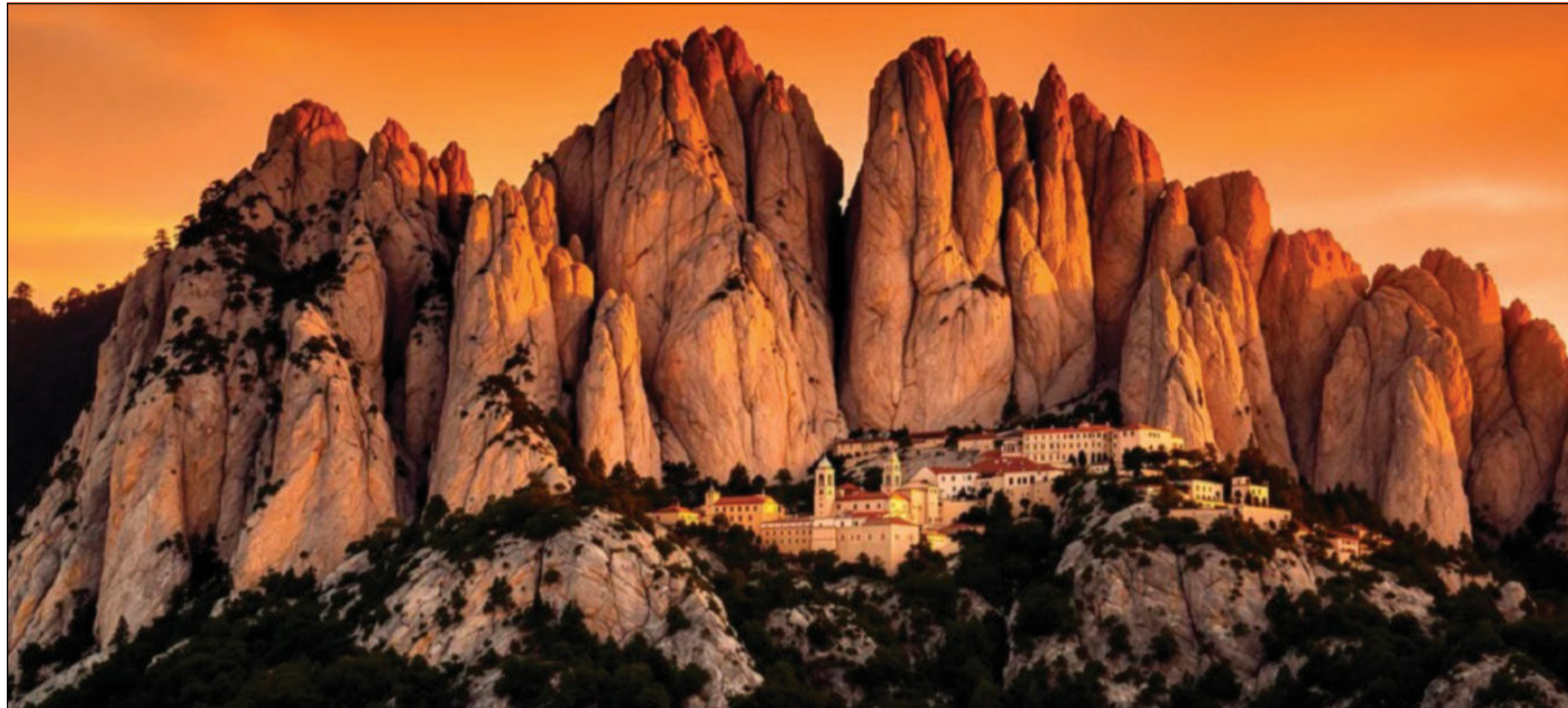
Il santuario mariano di Montserrat