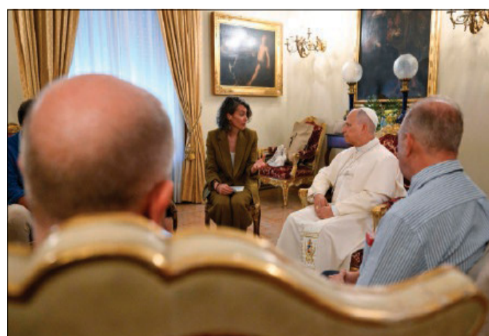
Alcune vittime di abusi, i cui volti non sono visibili, incontrano il Papa

Durante il pomeriggio di ieri, lunedì 8 giugno, nella nunziatura apostolica a Madrid, Leone XIV ha incontrato sei vittime di abuso da parte di membri del clero e della Chiesa in Spagna, accompagnate da personale ecclesiale impegnato nell'opera di vicinanza alle vittime. Lo rende noto la Sala stampa della Santa Sede attraverso il suo canale Telegram.